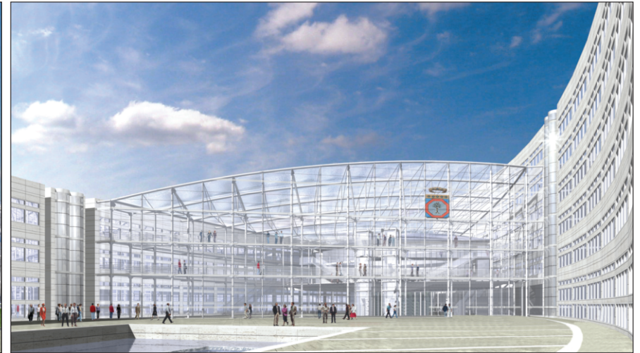
Progetto nuova sede Consiglio Regionale