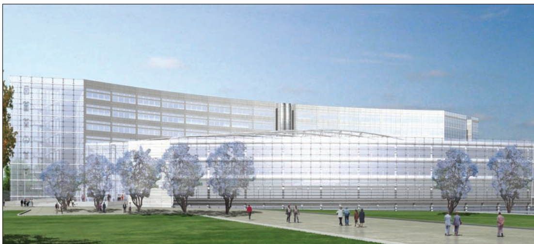
Progetto nuova sede Consiglio Regionale