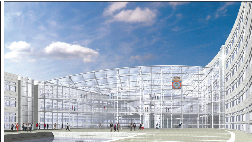
Progetto nuova sede Consiglio Regionale