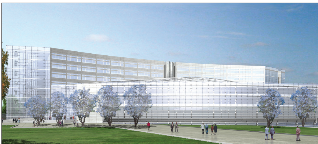
Progetto nuova sede Consiglio Regionale