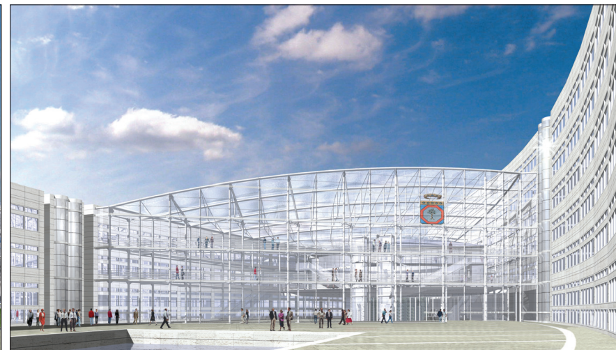
Progetto nuova sede Consiglio Regionale