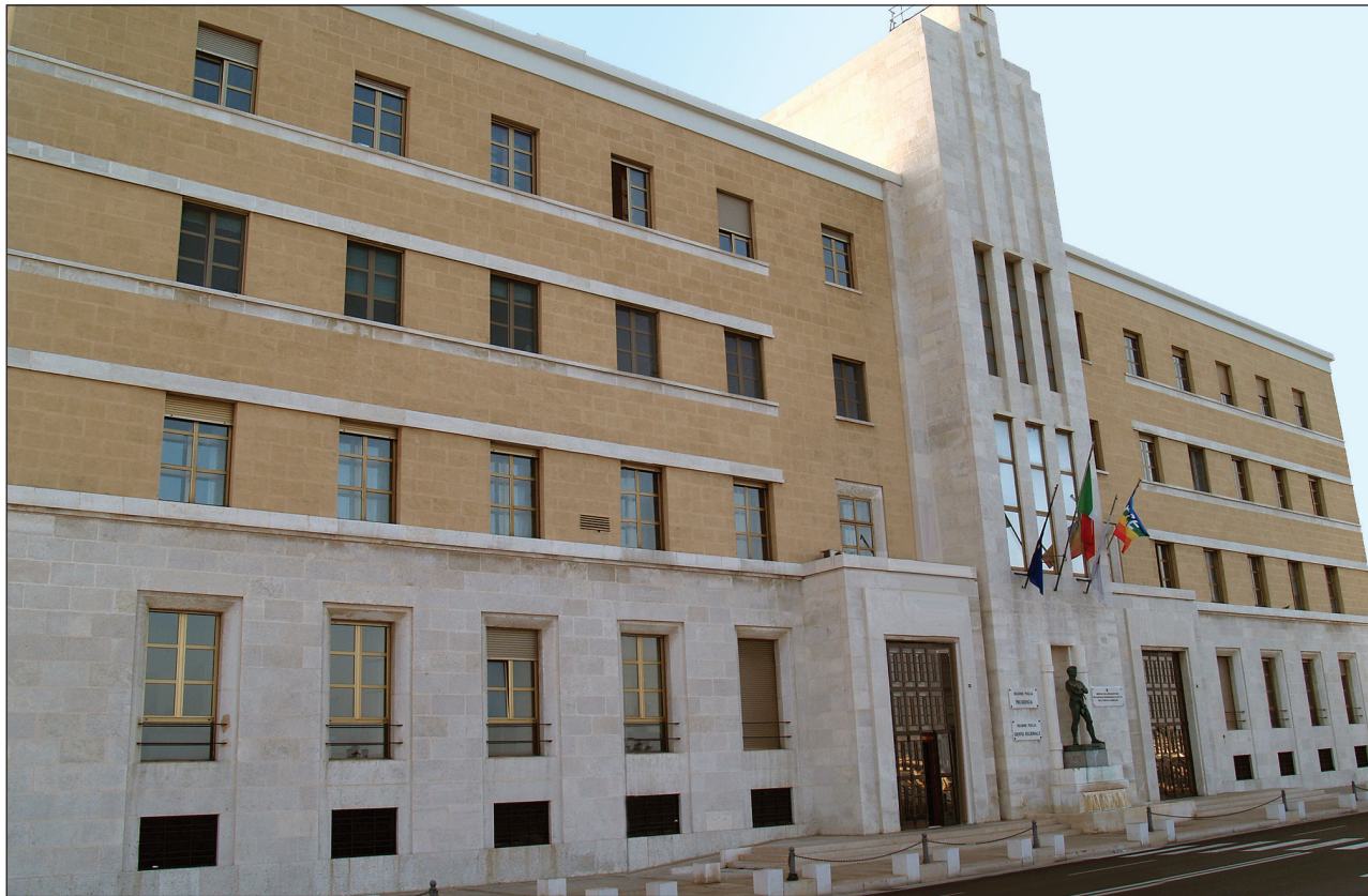
Sede Presidenza Giunta Regionale