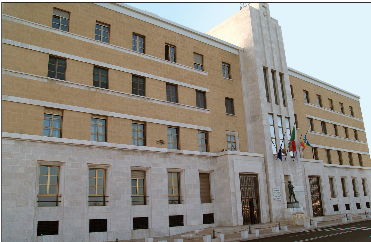
Sede Presidenza Giunta Regionale

Deliberazioni del Consiglio e della Giunta