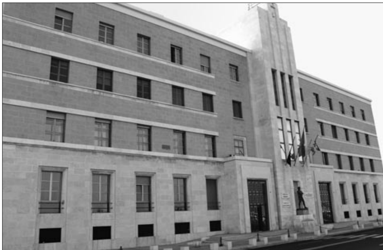
Sede Presidenza Giunta Regionale

Atti di organi monocratici regionali Atti e comunicazioni degli Enti Locali