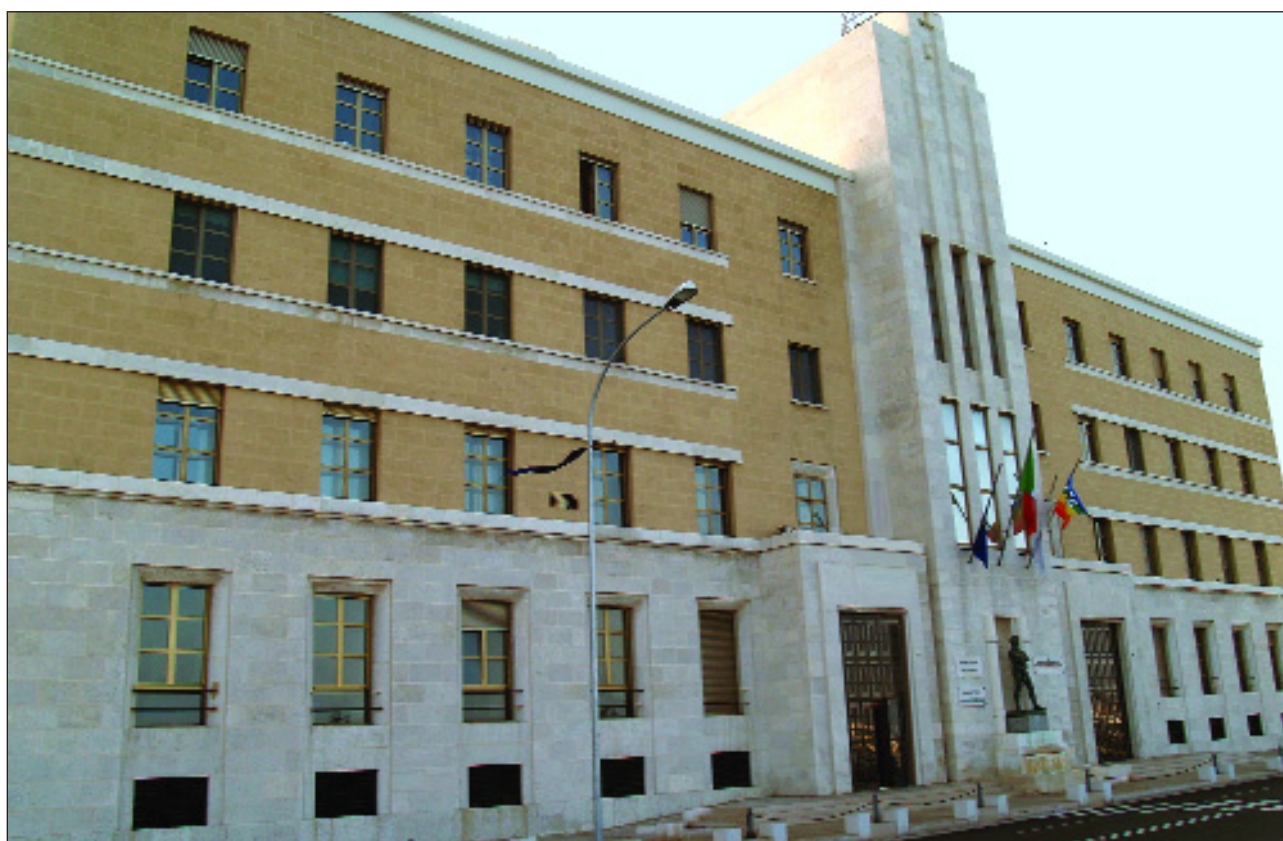
Sede Presidenza Giunta Regionale

Deliberazioni del Consiglio e della Giunta