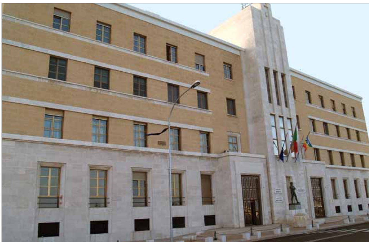
Sede Presidenza Giunta Regionale

Corte Costituzionale Deliberazioni del Consiglio e della Giunta Atti di Organi monocratici regionali Atti e comunicazione degli Enti locali