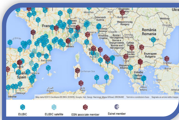
Dislocazione geografica del network EBN

Su delega della Regione Puglia, nella veste di società in house , è organismo intermedio per la gestione degli strumenti agevolativi finalizzati al sostegno delle imprese che realizzano investimenti sul territorio. Svolge, inoltre, il ruolo di organismo finanziario per la gestione degli strumenti finanziari. La società svolge le attività istituzionali di attrazione degli investimenti in Puglia e, sempre per conto della Regione Puglia, gestisce due incubatori di impresa localizzati nella zona industriale di Bari-Modugno e nella zona industriale di Casarano (LE). La società aderisce alla rete europea dei centri di innovazione EBN.