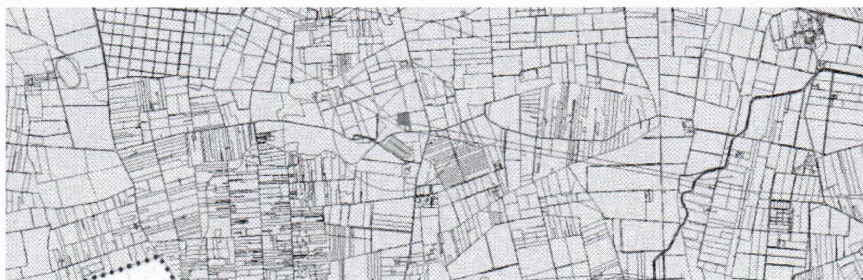
Stralcio PRG Comune di Brindisi