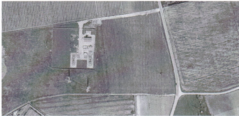
Ortofoto aerea cabina primaria

Sistema Nazionale per la Protezione dell'Ambiente