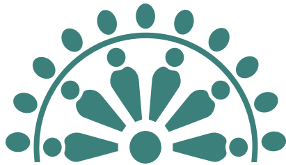
Rosone con luminarie esterne

Rosone composto dal modulo precedente con 6 "Luminaristi", 6 elementi, come le province che compongono la regione Puglia