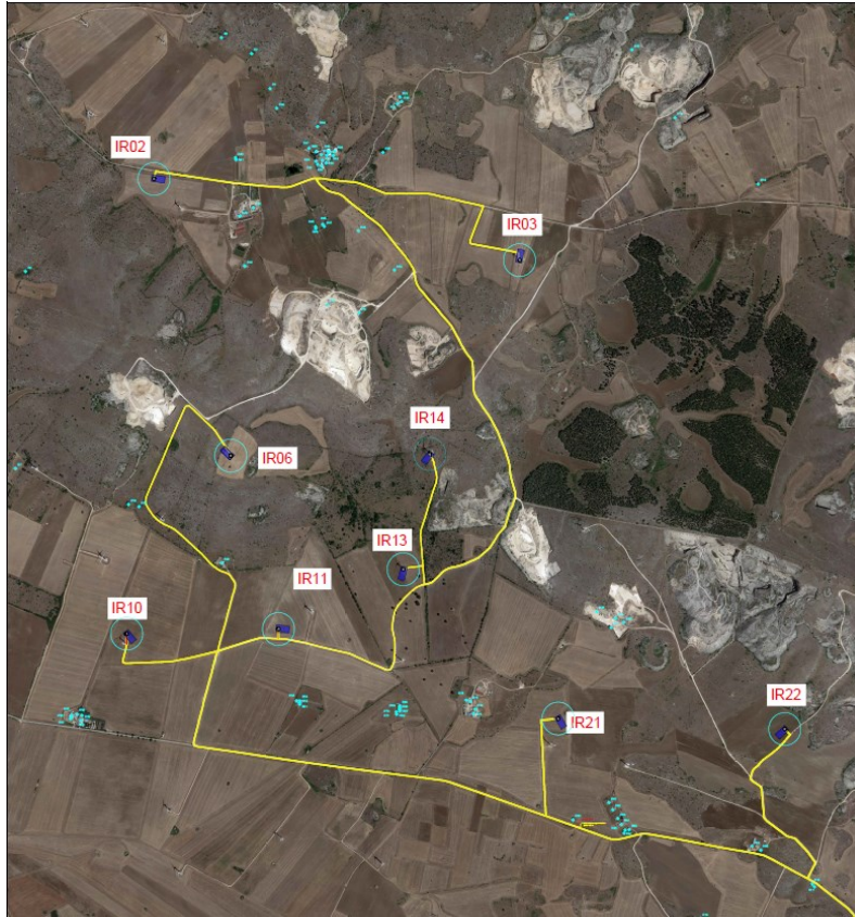
Figura 2 – Ortofoto delle aree interessate dal progetto.