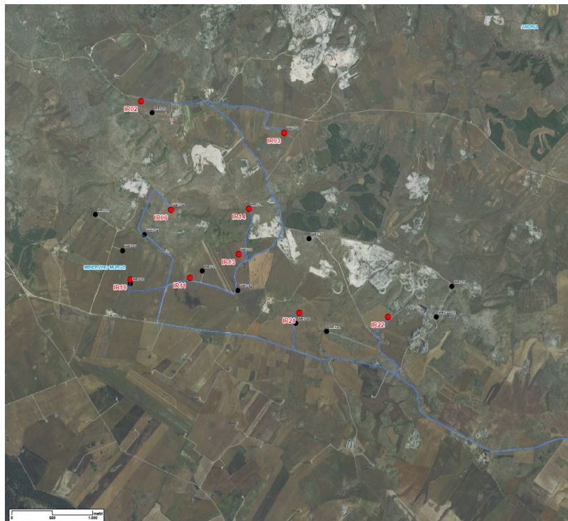
Figura 1 – Inquadramento territoriale del progetto

In Figure 1 e 2 è mostrato l'inquadramento territoriale del progetto.