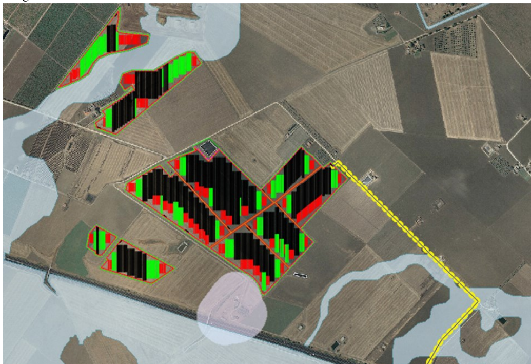
Figura 6 - Sito di impianto ed aree non idonee FER RR 24/2010

progetto è stato accuratamente sagomato in modo da non interessare neanche l'area di vincolo "Segnalazioni Carta dei Beni con buffer di 100 m".