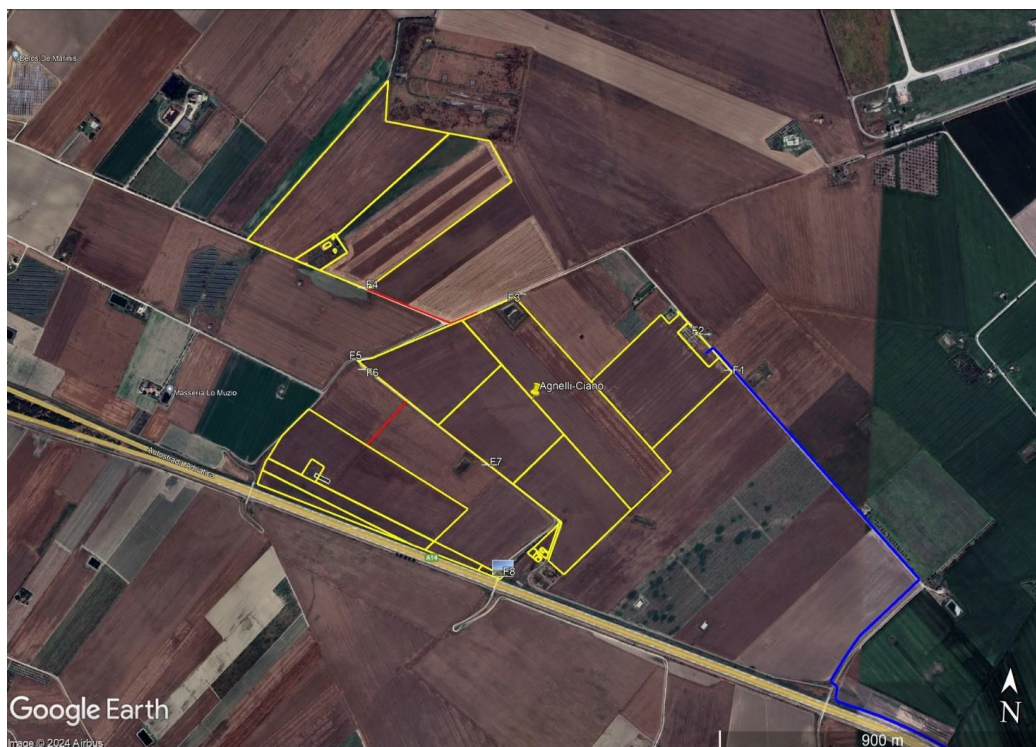
Figura 2 - Ortofoto delle aree interessate dal progetto.