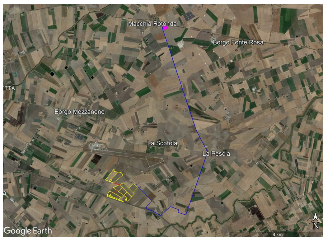
Figura 1 – Inquadramento territoriale del progetto

In Figure 1 e 2 è mostrato un inquadramento territoriale del progetto.