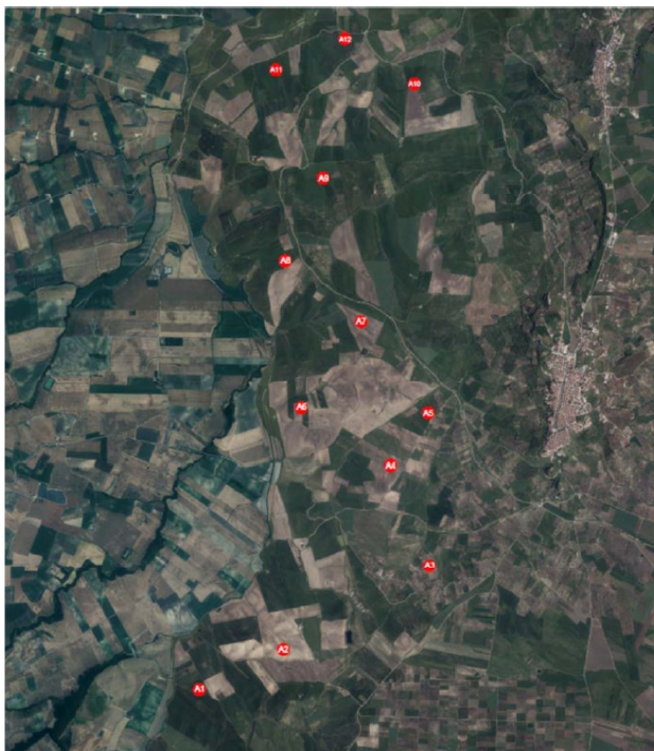
Figura 1: ubicazione aerogeneratori in area vasta

L'area di progetto si estende per circa 30 kmq su un territorio collinare, con quote che variano dai 40 m ai 160 m slm. La destinazione comunale è agricola con prevalenza di seminativi, solcata da varie aste torrentizie e servita prevalentemente da strade comunali ed interpoderali. (fig.1).