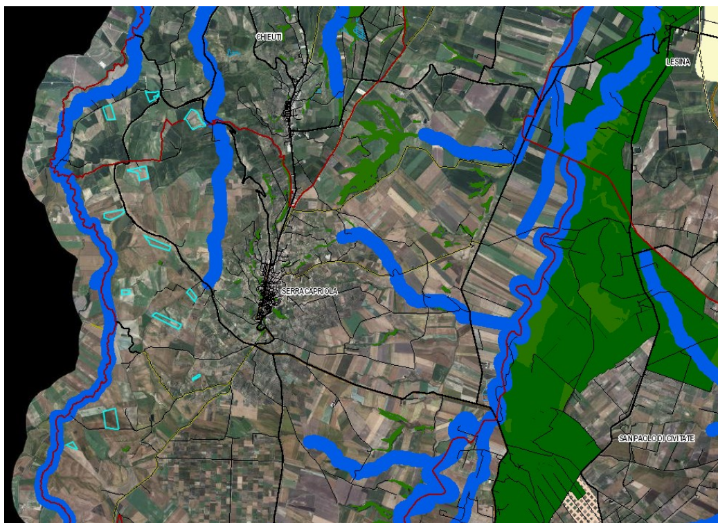
Figura 2: ubicazione catastale aerogeneratori e BP esistenti nell'area.