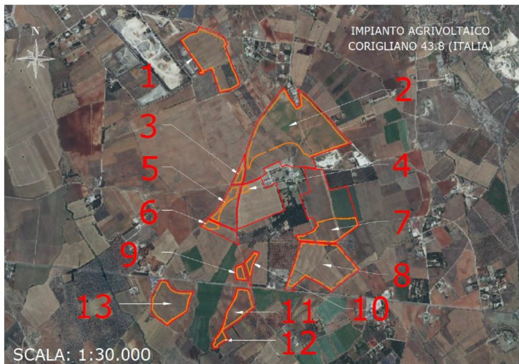
Figura 1: individuazione area di intervento e suddivisione sottocampi (elaborato di progetto)

L'impianto sarà realizzato con 558 strutture (tracker) in configurazione 2x56 moduli, 191 strutture (tracker) in configurazione 2x28 moduli, 195 strutture (tracker) in configurazione 2x14 moduli e 182 strutture (tracker) in configurazione 2x7 moduli in verticale con pitch pari a 9,85 m. In totale saranno installati 81.200 moduli fotovoltaici monocristallini della potenza di 670 Wp.