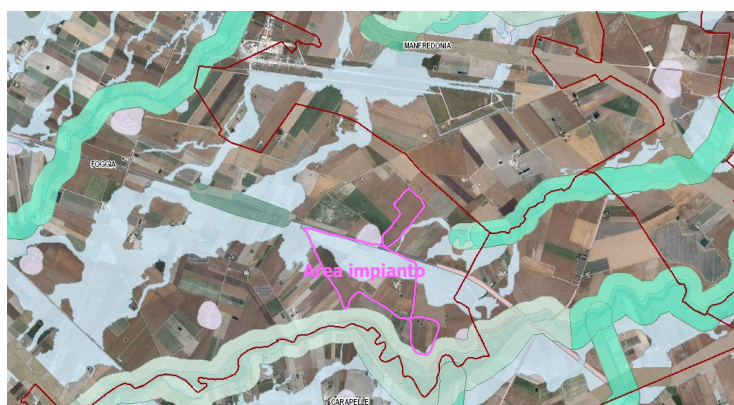
Figura 4 – Ubicazione dell'impianto rispetto alle aree non idonee ex R.R. 24/2010

L'area dell'impianto proposto rientra nelle aree non idonee ai sensi del regolamento regionale n. 24 del 2010: Segnalazione Carta dei Beni con buffer di 100 metri, Pericolosità idraulica del PAI Puglia. L'elettrodotto di connessione attraversa Tratturi con buffer di 100 metri, Fiumi Torrenti e corsi d'acqua con buffer di 150 m, Connessioni, Pericolosità idraulica del PAI Puglia. L'impianto fotovoltaico dista circa 6 Km da Siti di rilevanza naturalistica delle Componenti delle Aree Protette: IT9110032 – Valle del Cervaro, Bosco dell'Incoronata. Risulta necessaria la Valutazione di incidenza.