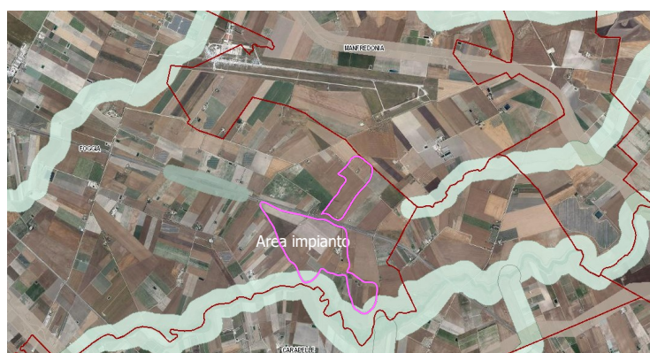
Figura 3 – Ubicazione dell'impianto rispetto alle aree Decreto Legislativo n.199 del 8 novembre 2021