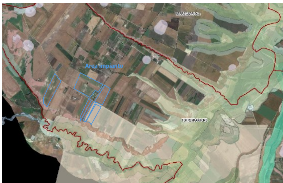
Figura 4 – Ubicazione dell'impianto rispetto alle aree non idonee ex R.R. 24/2010

L'area dell'impianto proposto rientra nelle aree non idonee ai sensi del regolamento regionale n. 24 del 2010. Tutta l'area rientra in Coni visuali e le aree C4-C5 sono interessata da Zona IBA, così come la sottostazione. Inoltre, l'elettrodotto di connessione attraversa zona IBA, zona SIC, Fiumi, torrenti e corsi d'acqua fino a 150m, Pericolosità idraulica, PUTT, versanti.