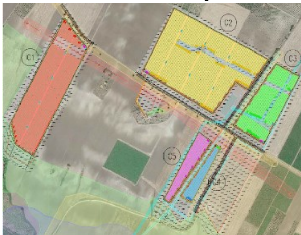
Figura 1 – Area impianto

La connessione dell'impianto sarà realizzata mediante un cavo interrato in 36 kV dalle cabine di trasformazione, poste all'interno dell'impianto, fino alla nuova stazione della RTN denominata "Torremaggiore". Complessivamente la connessione avrà una lunghezza di circa 8 km.