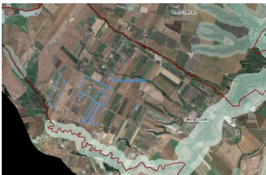
Figura 3 – Ubicazione dell'impianto rispetto ai beni sottoposti a tutela