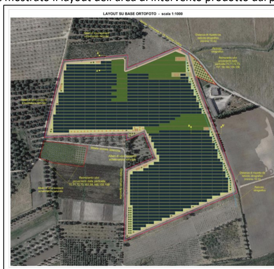
Fig. 1: Inquadramento dell'impianto su ortofoto.

Nella figura sottostante è mostrato il layout dell'area di intervento prodotto dal proponente.