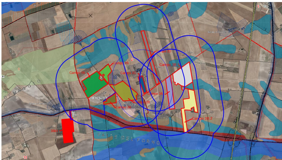
Figura 2 La fascia di rispetto di 500 metri, pur interessando vari BP e UCP non coinvolge Beni sottoposti a tutela ai sensi dell'art. 136 del Codice dei Beni culturali e del paesaggio, pertanto l'area risulta idonea (art. 20 co. 8 lettera c-quater).