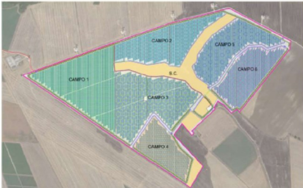
Figura 3: aree di installazione pannelli fotovoltaici