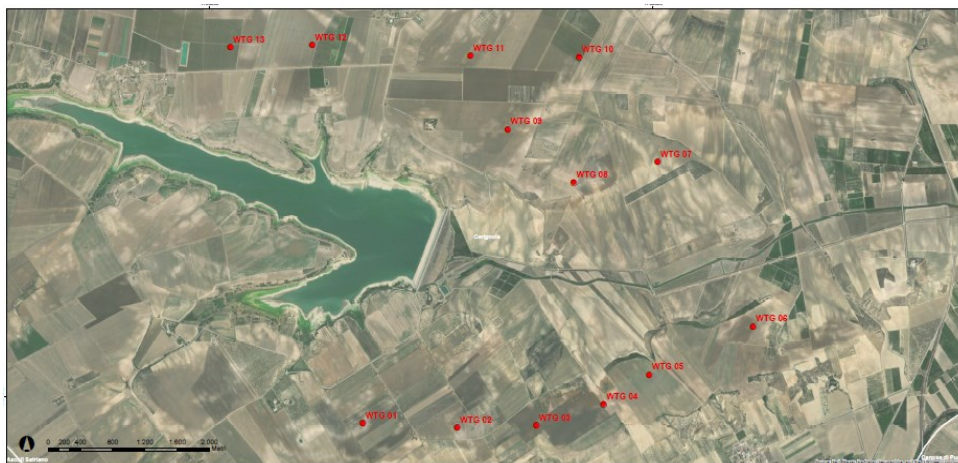
Figura 2 – Particolare dell'inquadramento su ortofoto dell'area di progetto