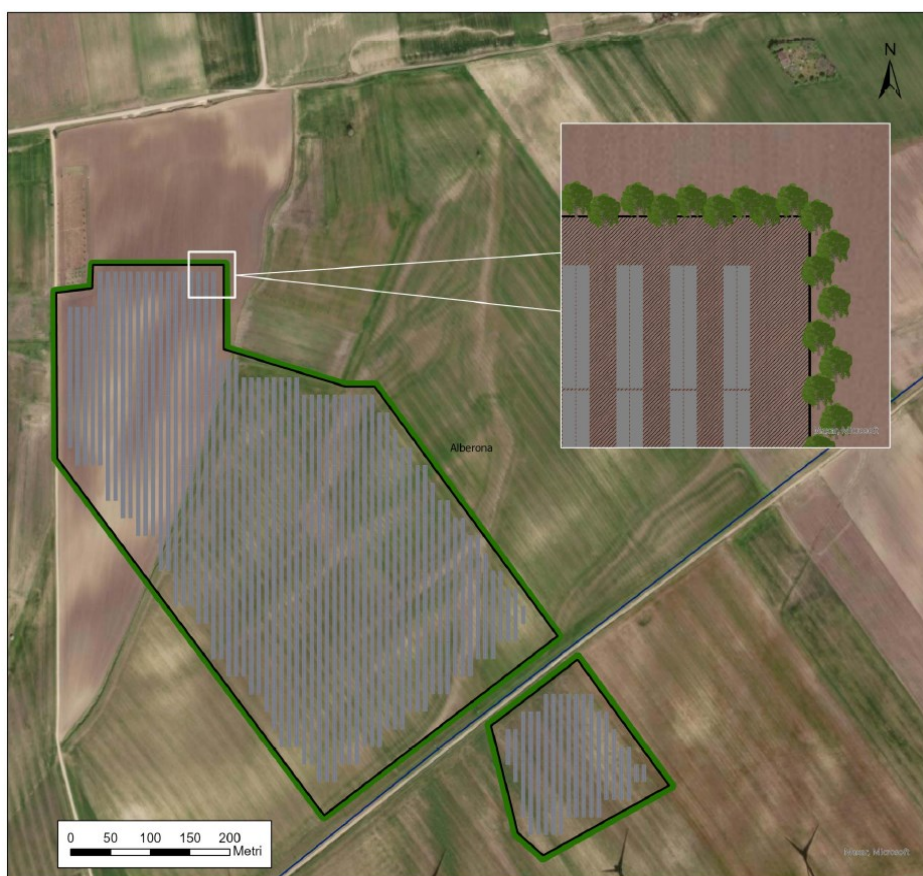
Figura 5: barriera arborea perimetrale

Il progetto prevede la realizzazione di una fascia arborea che consentirebbe di mitigare l'impatto visivo dell'impianto.