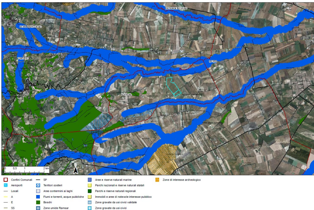
Figura 3: stralcio PPTR con inserimento catastale impianto