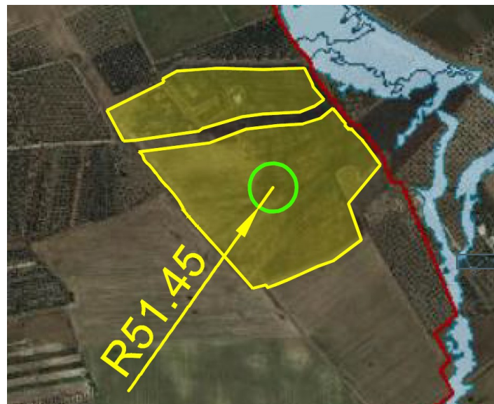
Fig. 2 - Particolare dell'impianto rispetto alle aree non idonee ex RR 24/2010