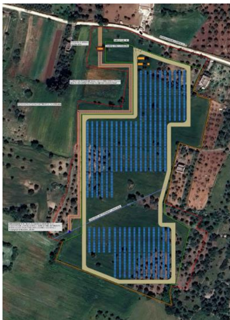
Figura 1 - Ortofoto impianto fotovoltaico.

In ordine alla sovrapposizione dell'intervento con la vincolistica del Piano di Tutela delle Acque (il cui aggiornamento 2015-2021 è stato approvato con D.C.R. n. 154 del 23/05/2023) , si evidenzia che le opere sono sottoposte a vincolo di buffer zone di Zone a Protezione Speciale Idrogeologica di tipo B.