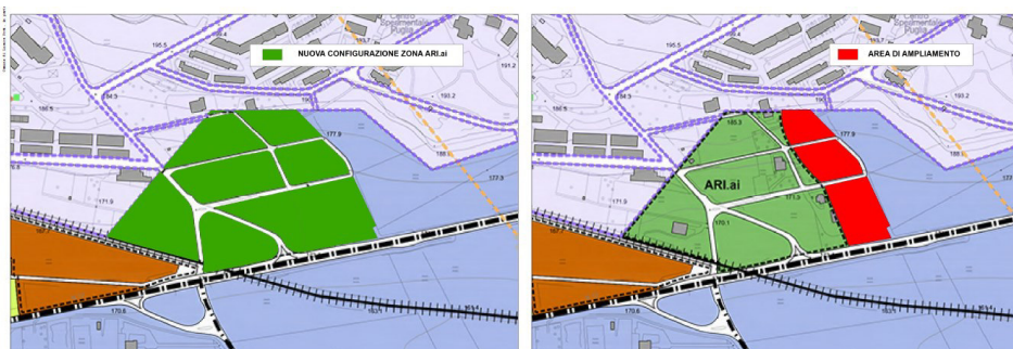
Fig. 12–Area oggetto di variante con relativo ampliamento