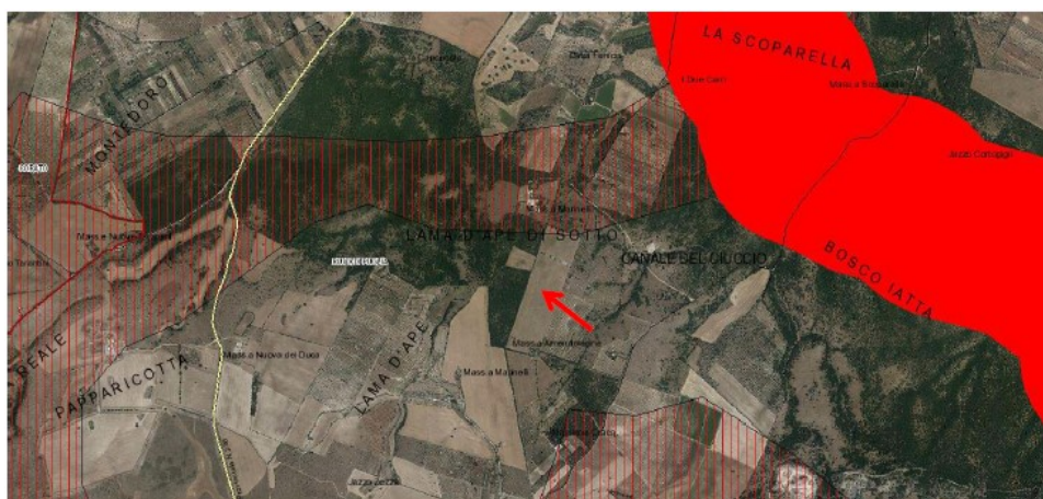
Classificazione secondo il Piano di Tutela delle Acque.

L'area di progetto è situata quasi completamente nella zona di tipo "B", tranne che per un piccolo lembo situato a nord ovest del terreno in esame. Nello specifico tale piccola porzione viene considerata come di tipo "A" tra le Zone di Protezione Speciale Idrogeologica (ZPSI).