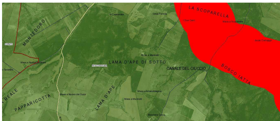
Corpi idrici acquiferi calcarei cretacei utilizzati a scopo potabile