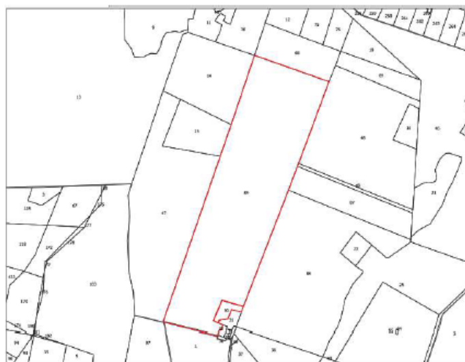
Stralcio inquadramento catastale