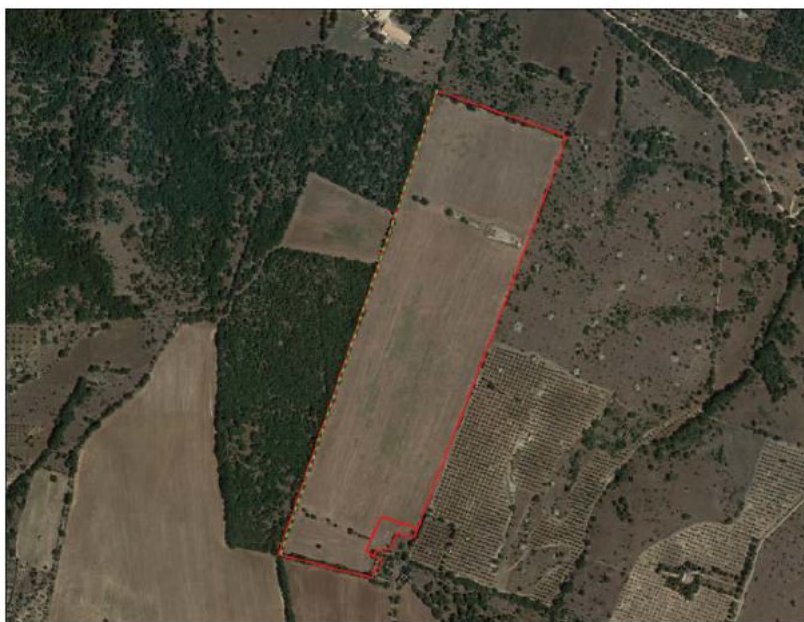
Stralcio inquadramento su ortofoto

Il sito è localizzabile come di seguito: