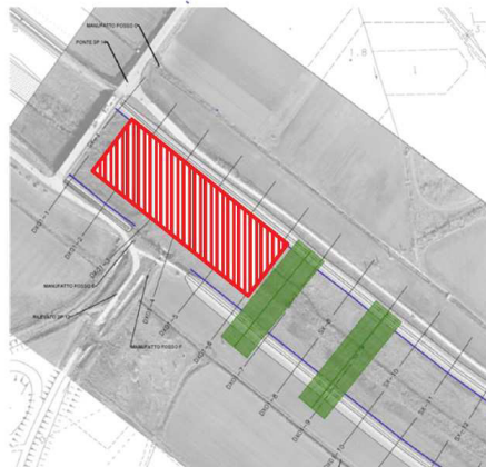
Fig.1) Tratto di fiume interessato dai lavori di pulizia: Ponte SP14 – Sez. 6-6

I lavori di pulizia dell’alveo previsti sono sinteticamente di seguito declinati: