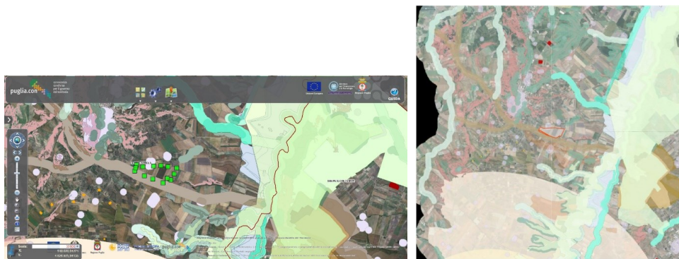
Fig. 5 - layout di progetto rispetto alle aree non idonee classificate da R.R. 24 del 2010

L'area di impianto ricade nella fascia di rispetto del bene culturale "Masseria la Loggia" – Segnalazione Architettonica.