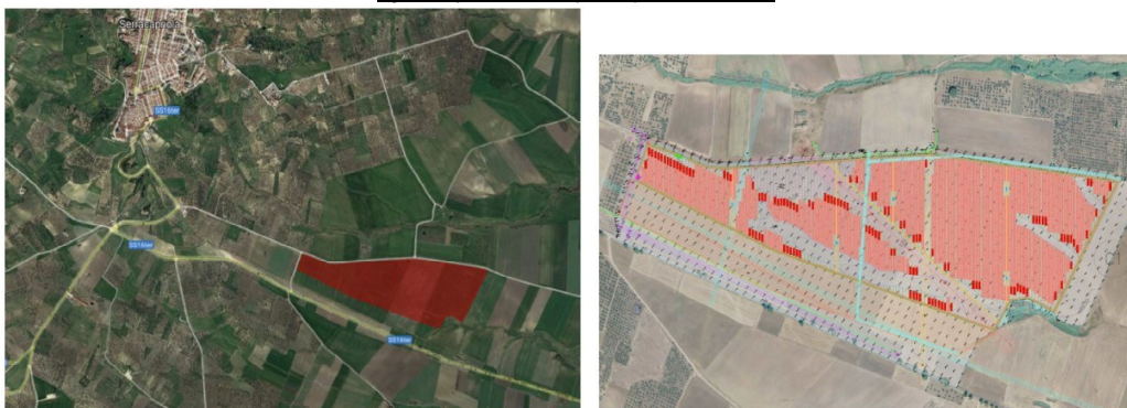
Fig. 2 – inquadramento layout impianto su ortofoto