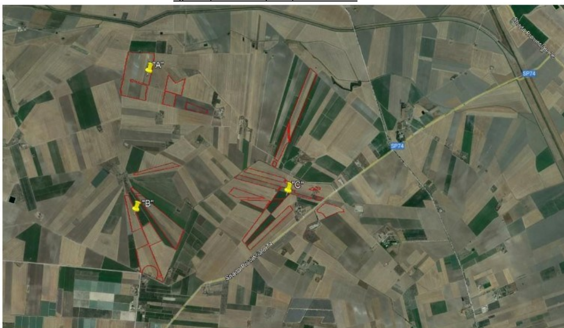
Fig. 2 – inquadramento layout impianto su ortofoto