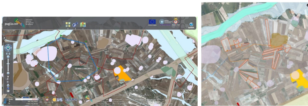
Fig. 4 - layout di progetto rispetto alle aree non idonee classificate da R.R. 24 del 2010

L'area dell'impianto proposto non ricade tra quelle indicate come non idonee ai sensi del regolamento regionale n. 24 del 2010 come si evince dalla Fig. 4