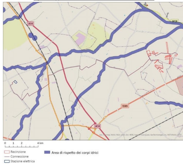
Fig. 3 - Mappatura delle Aree Idonee D.L. 199/2021 e s.m.i.

lett. c-quater) non ricade nella fascia di rispetto dei beni sottoposti a tutela (500 metri per gli impianti fotovoltaici, come si evince dalla Fig. 3.