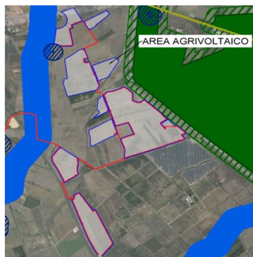
Fig. 2 - Particolare dell'impianto rispetto alle aree non idonee ex RR 24/2010