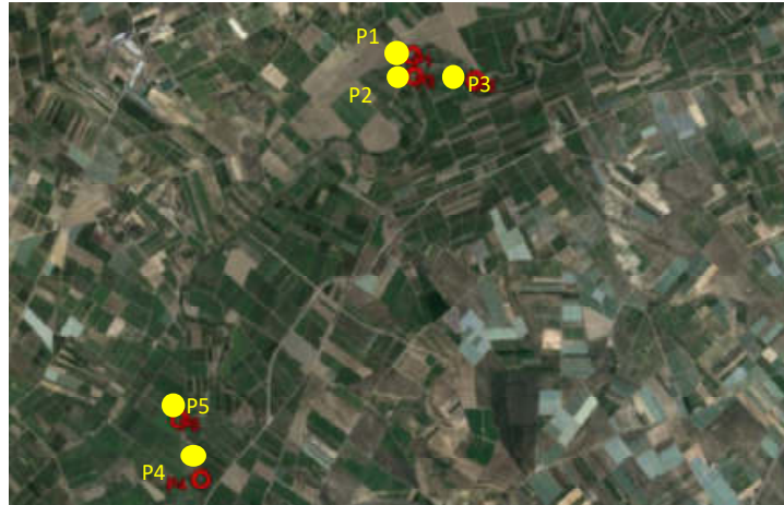
Area di indagine

Dall'analisi dei campioni e prove di laboratorio il Proponente determina, sulla scorta di analisi granulometrica e dei limiti di Atterberg, la seguente classificazione dei campioni: