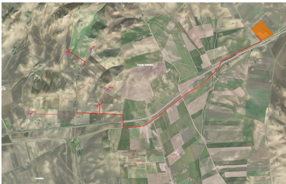
Inquadramento su IGM del parco eolico ridimensionato a 5 aerogeneratori

Nelle integrazioni documentali del febbraio 2024 (pubblicazione sul Sit/Puglia 08/02/2024), la società proponente ha riscontrato le richieste della Commissione Tecnica, aggiornando gli elaborati di progetto definitivo e gli elaborati per la valutazione di impatto ambientale del nuovo layout progettuale.