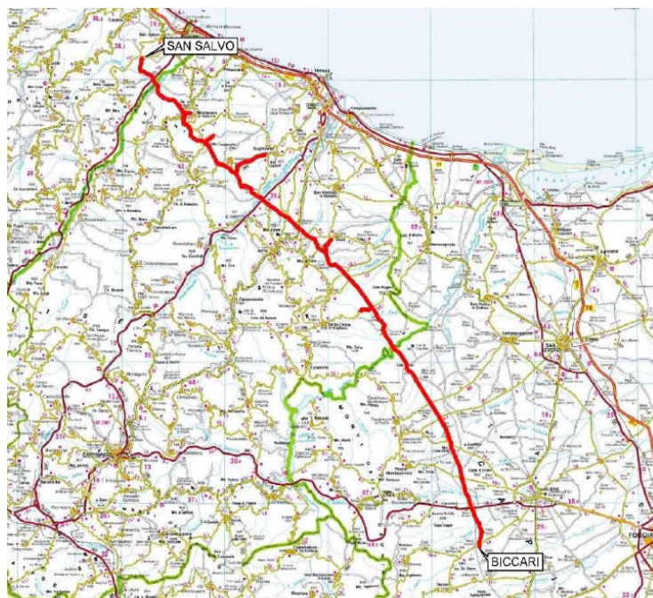
Inquadramento opera in progetto

Il tracciato è riportato nell'immagine seguente.