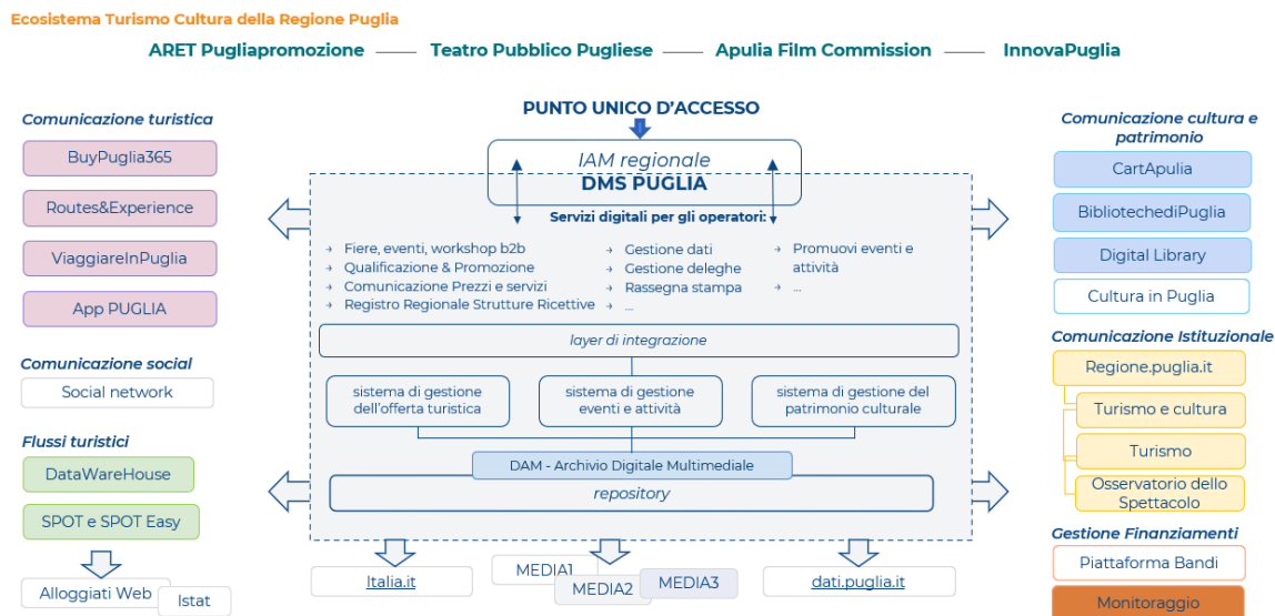
Figura 2 - Ecosistema Digitale Integrato del Turismo e della Cultura.

In Figura 2 una rappresentazione schematica dell'Ecosistema.