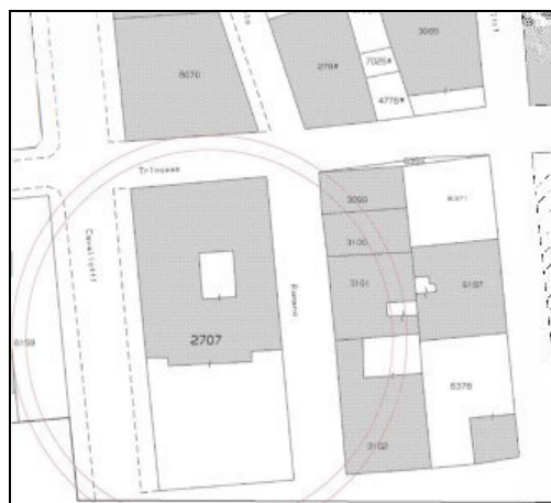
Fig. 3 Inquadramento area di variante catastale