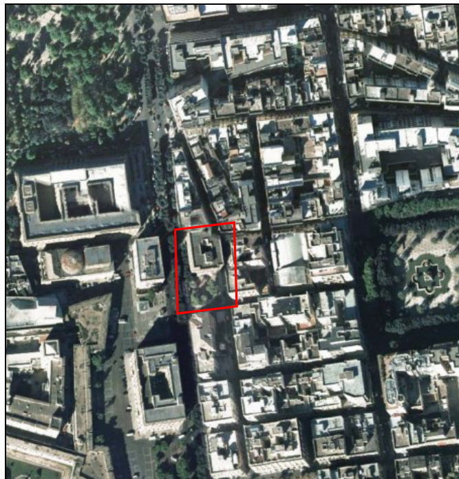
Fig. 1 Inquadramento su ortofoto area di variante

L'area di proprietà, oggetto dell'intervento, è classificata, per l'edificio, quale zona "F/23 – Attrezzature collettive di interesse private" (art. 98 NTA di PRG) e, per lo scoperto di pertinenza, quale "Verde privato o di pertinenza di edifici di interesse collettivo" (art. 61 NTA di PRG).