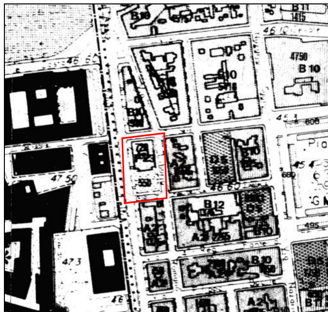
Fig. 2 Inquadramento area di variante su estratto PRG

DIPARTIMENTO AMBIENTE, PAESAGGIO E QUALITÀ URBANA SEZIONE URBANISTICA SERVIZIO STRUMENTAZIONE URBANISTICA