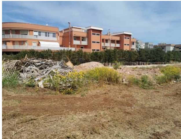
PUE Iagravinese - Lotto E