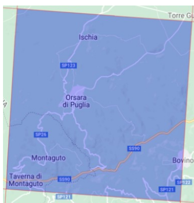
10kmE476N203 cella reporting direttiva dati 4° report (2013-2018)

Dalla consultazione dei link http://reportingdirettivahabitat.isprambiente.it/habitat-cellcodes-search e http://reportingdirettivahabitat.isprambiente.it/species-cellcodes-search che riportano i dati aggiornati all'ultimo rapporto ex Articolo 17 della Direttiva Habitat 92/43/CEE (in grado di rendicontare lo stato di conservazione e i trend delle specie e degli habitat italiani di interesse comunitario), lo scrivente ha verificato la presenza di habitat e di specie faunistiche nell'area di intervento ricadente nelle celle 10kmE476N203 e 10kmE477N203 così come mostrato nella seguente figura: