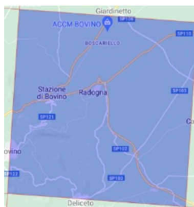
10kmE477N203 cella reporting direttiva dati 4° report (2013-2018)

Nelle seguenti tabelle si riporta l'elenco degli habitat e delle specie faunistiche potenzialmente presenti all'interno delle celle 10km E476N203 e 10km E477N203 così come previsti negli strati informativi del suddetto Reporting Direttiva Habitat.