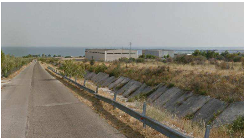
Fig. 5 - Vista del Vallone Palombaro dalla strada che lo lambisce

SERVIZIO OSSERVATORIO E PIANIFICAZIONE PAESAGGISTICA