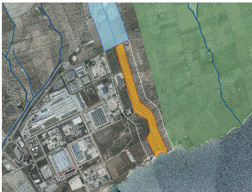
Fig. 7 - In bianco il tratto del Vallone Palombaro di cui si propone l’irrelevanza ai fini paesaggistici, in verde l’area a vincolo paesaggistico, in arancione l’UCP “Reticolo idrografico di connessione RER” proposto.

Considerato che l’intera sinistra idrografica è esterna alla zona ASI ed a destinazione prevalentemente agricola non interessata da trasformazioni edilizie si ritiene sussista, per il corso d’acqua in esame, l’esigenza di mantenere la tutela relativa alla connessione ecologica, anche al fine di costituire una fascia verde di rispetto della medesima zona ASI. È pertanto opportuno prevedere una zona di tutela da iscrivere nella categoria UCP “reticolo idrografico di connessione della RER” della estensione di 75 m a partire dall’asta del corso d’acqua sulla sinistra idrografica ed a fino alle aree tipizzate e attrezzate dell’ASI di Monte Sant’Angelo, sulla destra idrografica, così come rappresentata in fig. 7.