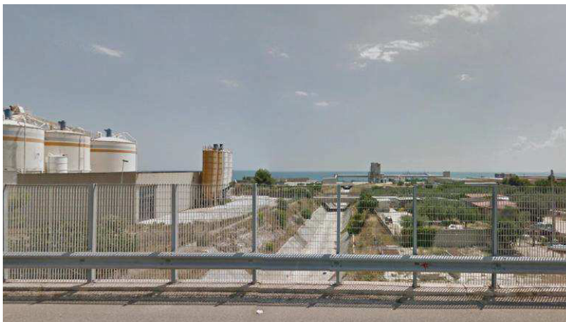
Fig. 2 - Vista del "vallone Pulsano" dalla SS 89 "Garganica" - agosto 2012.

Il tratto di corso d'acqua in esame rientra quindi pianamente nei criteri n. 2. "Alterazione del corso d'acqua tale da aver causato la perdita di qualunque valore paesaggistico quando lo stesso è inserito in un contesto fortemente antropizzato" e n. 3 "Deviazione di tratti di corso d'acqua dal loro percorso naturale in canali caratterizzati dalla artificializzazione degli argini" , di cui alla DGR n. 1503/2014.