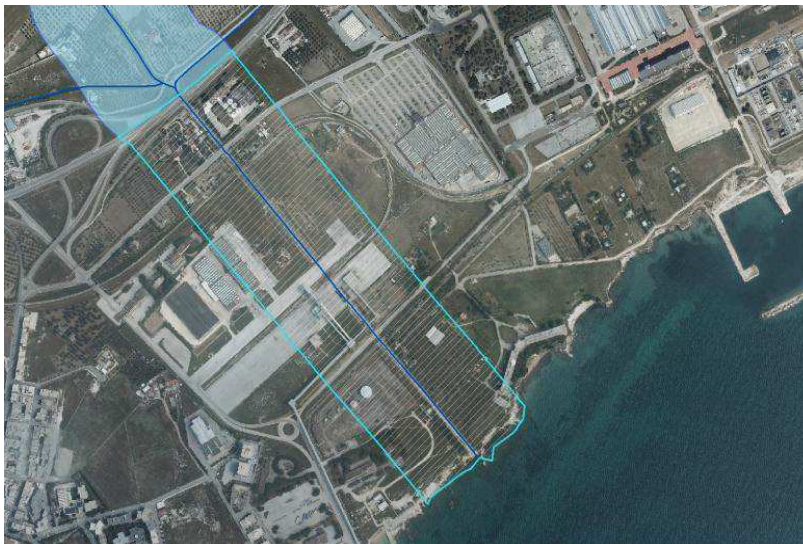
Fig. 3 - In bianco il tratto del Vallone Pulsano di cui si propone l'irrelevanza ai fini paesaggistici.