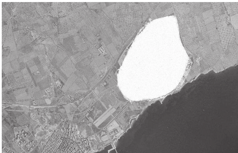
Fig. 1 - Ortofoto 1988 in cui si evince la presenza dell'ASI, parzialmente obliterata per motivi di sicurezza.

Il Vallone di Pulsano, discende dall' altopiano "Scalogna", così denominato nelle cartografie storiche, e segue il suo corso naturale fino alla confluenza con due canali collettori che lo intersecano a monte della SS 89 "Garganica". Da questo punto in poi il corso d'acqua risulta deviato dal suo percorso storico, e rettificato ed irregimentato in un alveo interamente realizzato in calcestruzzo armato che attraversa la Zona industriale di Manfredonia – Monte Sant'Angelo (ASI Foggia). Il corso d'acqua è in più punti sormontato da opere civili ed industriali quali ponti, piastre, nastri trasportatori, condotte, binari ferroviari che ne rafforzano il carattere di opera artificiale di irregimentazione delle acque.