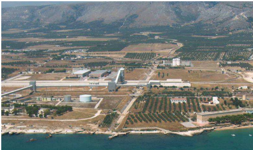
Fig. 4 – Vista aerea del tratto del Vallone Pulsano di cui si propone l'irrelevanza ai fini paesaggistici

SERVIZIO OSSERVATORIO E PIANIFICAZIONE PAESAGGISTICA