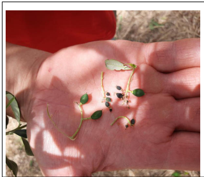
Olivo – particolare dei danni subiti dalle mignole e dai frutticini

riscontrati due tipi di danni: la rottura di parte delle mignole con i frutticini allegati e la morte "apoplettica" di frutti dovuta alle loro piccole dimensioni ed alle lesioni provocate dalla grandine a livello del pedicello.