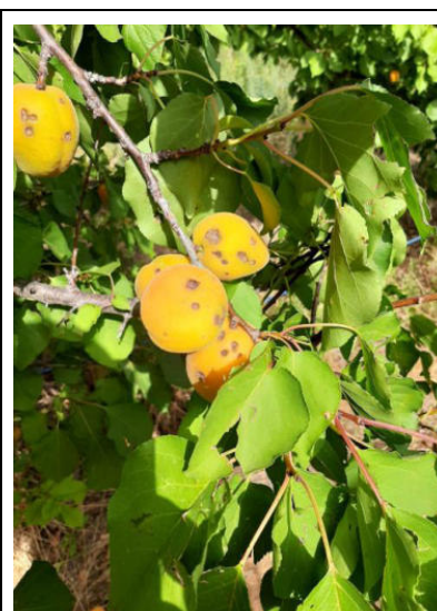
Fruttiferi – Albicocche semi-precoci