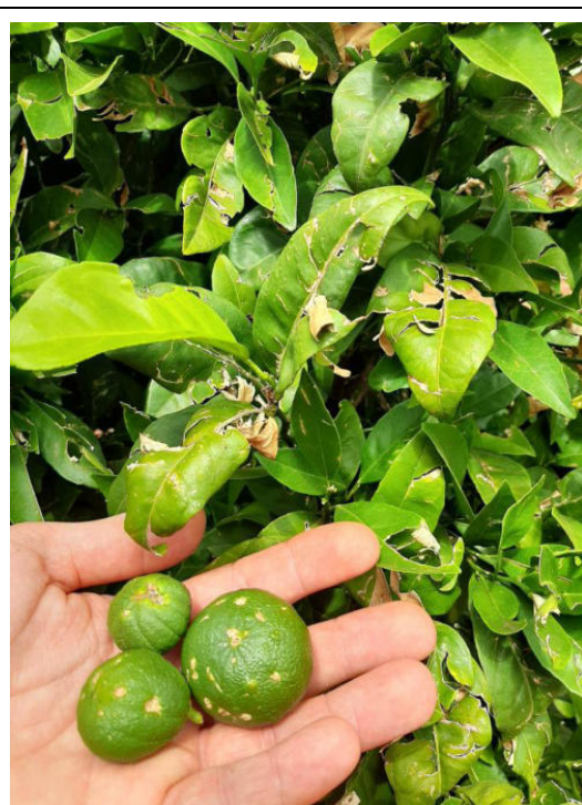
Agrumi - Arance