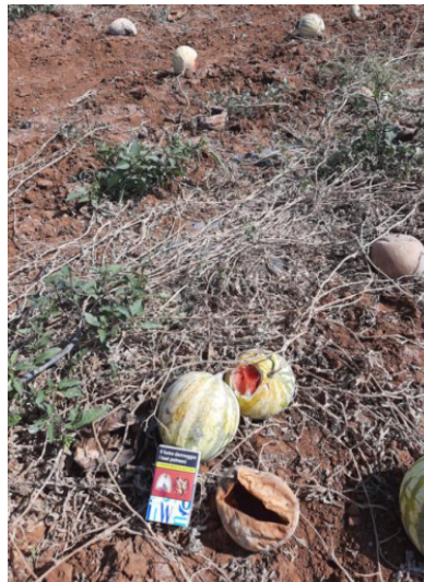
Ortaggi – Danni su Angurie