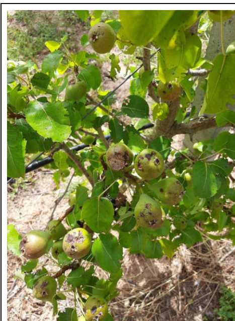
Fruttiferi – Danni sulle pere

DIPARTIMENTO AGRICOLTURA, SVILUPPO RURALE ED AMBIENTALE SEZIONE COORDINAMENTO DEI SERVIZI TERRITORIALI SERVIZIO TERRITORIALE DI TARANTO