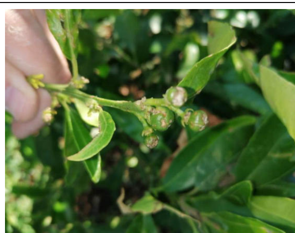
Agrumi – Mandarini

DIPARTIMENTO AGRICOLTURA, SVILUPPO RURALE ED AMBIENTALE SEZIONE COORDINAMENTO DEI SERVIZI TERRITORIALI SERVIZIO TERRITORIALE DI TARANTO