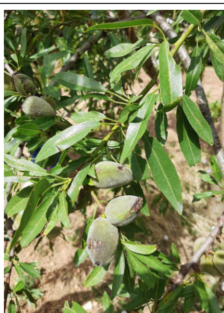
Fruttiferi – Effetti della grandine sulle mandorle