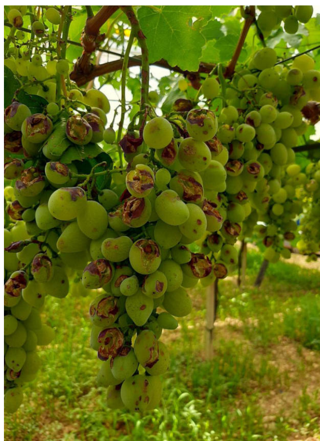
Uva da tavola – danni sul grappolo in un vigneto coperto con teli

DIPARTIMENTO AGRICOLTURA, SVILUPPO RURALE ED AMBIENTALE SEZIONE COORDINAMENTO DEI SERVIZI TERRITORIALI SERVIZIO TERRITORIALE DI TARANTO