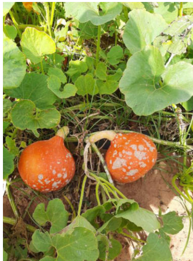
Ortaggi – Danni su Zucca

Le coltivazioni di angurie sia in coltura a pieno campo che in coltura forzata con tunnelino, al momento dell'evento, si trovavano con stadi fenologici di crescita differenti. Le angurie coltivate con forzatura, oramai scoperte dal film plastico, si trovavano con la vegetazione già formata e con la presenza di frutti. La grandine oltre a provocare danni sui frutti, ha interessato la vegetazione, determinando la rottura dei "palchi produttivi" e la perdita della parte vegetativa. In questa condizione, i frutti, hanno arrestato la fase di accrescimento-maturazione andando incontro al fenomeno di "marcescenza". Per le coltivazioni in pieno campo con piante e fiori già formati, la grandine ha distrutto completamente la parte vegetativa.