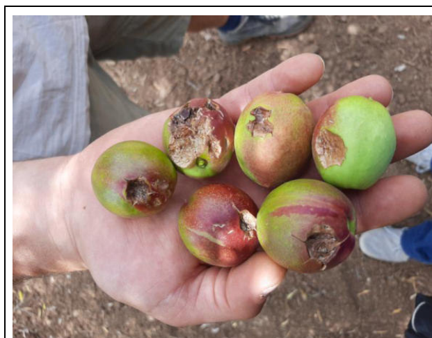
Fruttiferi – Danni da grandine sulle Pesche nettarine

Per le mandorle, che si trovavano nella fase fenologica di "indurimento del nocciolo", le lesioni provocate sulla buccia, hanno determinato un blocco della distensione del mesocarpo con conseguente caduta di parte dei frutti. Inoltre a seguito delle lesioni sulla buccia, i frutti si sono resi non commerciabili per l'istaurarsi della Gommosi parassitaria ( Stigmina carpophila ) con la fuoriuscita di essudati.