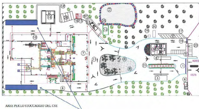
Planimetria relativa all'impianto Progetto Ambiente Provincia di Lecce sito in Cavallino.