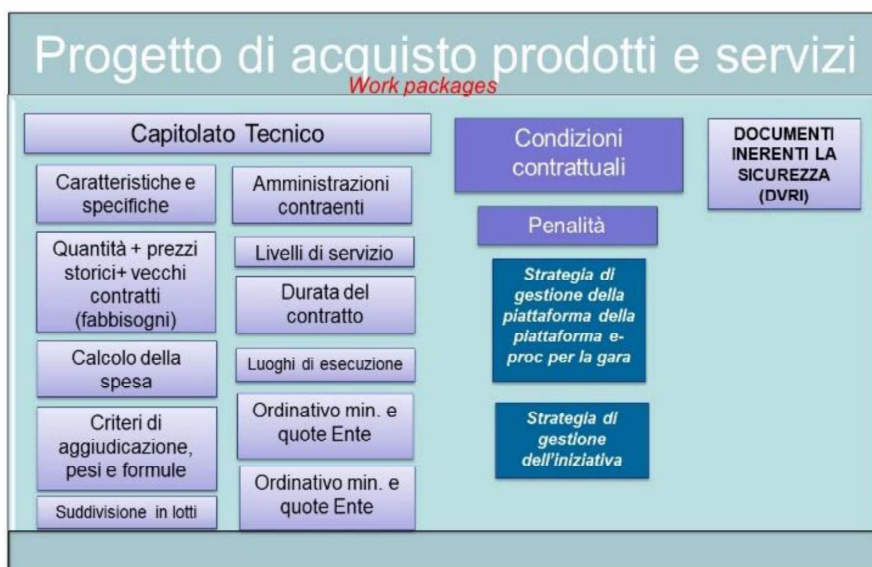
Figura 2 - Progetto di acquisto

Nel corso del 2020 il personale del Soggetto Aggregatore ha partecipato attivamente a numerosi tavoli tecnici per 19 giornate complessive. Le merceologie trattate sono state diabetologia