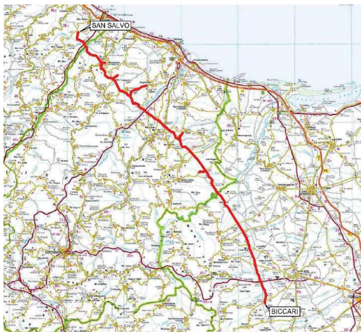
Inquadramento opera in progetto

Il tracciato è riportato nell'immagine seguente.