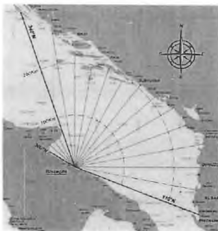
Figura 1 - Settore di traversia / fetch geografici

Il tratto di litorale in esame è sottoposto al settore di traversia principale individuabile fra la radente al promontorio del Gargano [340°N] e quella il porto di Bari [110°N]. Ondazioni minori sono comunque possibili dalle ulteriori direzioni di generazione all'interno del Golfo di Manfredonia [300 - 340°N]. (Figura 1).