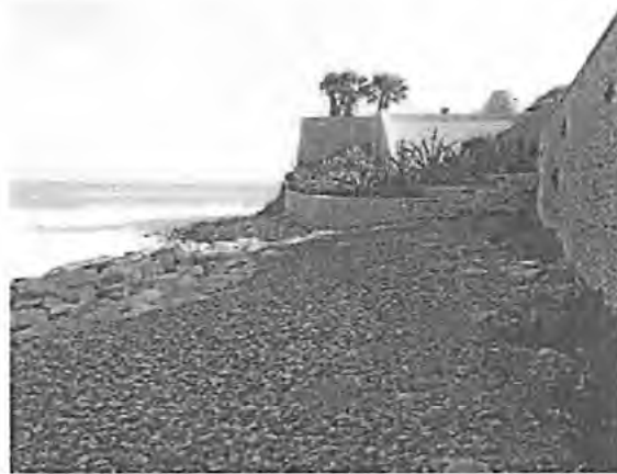
Foto 2 - stato del litorale al limite Est dell'Unità Funzionale oggetto d'intervento

Come mostrato nell'Allegato PL.GEN_01, la falcata oggetto degli interventi presenta, a partire dal suo limite Est (nei pressi dell'Anfiteatro Mediterraneo) una zona di transizione in cui scheggioni calcarei di varia pezzatura posti alla rinfusa (Vedi Foto 1) lasciano spazio ad una difesa radente in massi calcarei di l. Cat. posta a protezione di un precedente ripascimento costiero in ciottoli di fiume dalla variegata colorazione (Vedi Foto2)