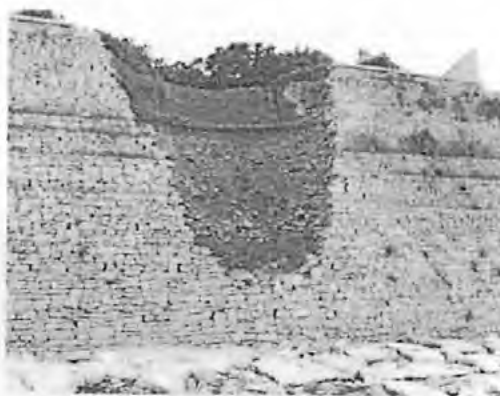
Foto 6 - Cedimento del muro sull'UF3

La riqualificazione di questa porzione di falesia sarà ottenuta mediante: