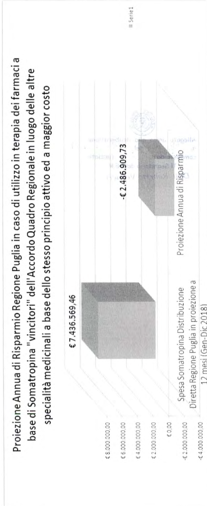
Tab. 3. Proiezione di risparmio annua.

Allegato A alla DGR recante "Misure per la razionalizzazione della spesa farmaceutica - Interventi volti ad incrementare l'appropriatezza prescrittiva sui farmaci biotecnologici ad alto costo a base di Somatropina".