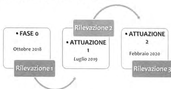
Figura 1. Il percorso di ricerca del programma P.I.P.P.I.

La possibilità di avere strumenti di conoscenza che documentino il rapporto tra il bisogno espresso dalla persona e la risposta fornita è utile per dare forma al lavoro sociale, al fine di renderlo verificabile, trasmissibile e comunicabile anche all'esterno.