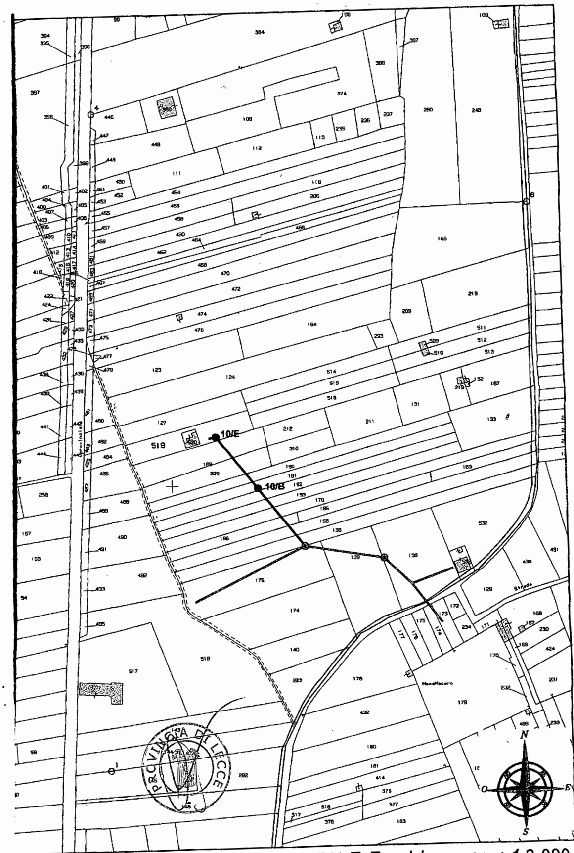
Comune di CUTROFIANO CATASTALE FG. 4/4 Scala 1:2 000