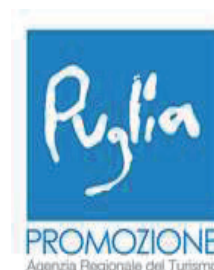
Puglia PROMOZIONE Agenzia Regionale del Turismo

Assessorato Industria Turistica e Culturale Gestione e Valorizzazione dei Beni Culturali