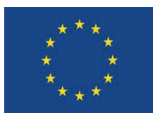
Unione Europea POR FESR-FSE 2014-2020 Asse IV - Azione 6.8